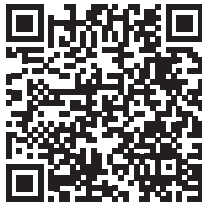
Johtamisen ja yritysjohtamisen erikoisammattitutkinto